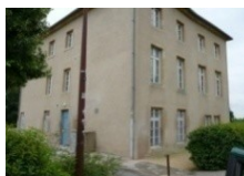
Site de La grange aux Bois