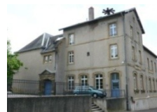
Site de Metz-Queuleu