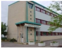
Site de Montigny