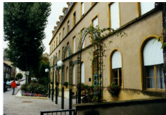
Site de Metz-Sablon