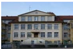
Site de Saint-Julien