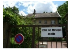
Site du Ban Saint-Martin